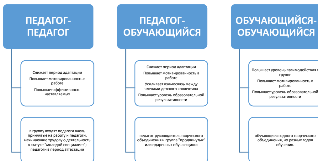
Рис. 1 «Наставничество молодых специалистов»

В образовательном учреждении разработано «Положение о наставничестве». На начала года формируются наставнические группы – педагог-педагог, педагог-обучающийся, обучающийся-обучающийся.