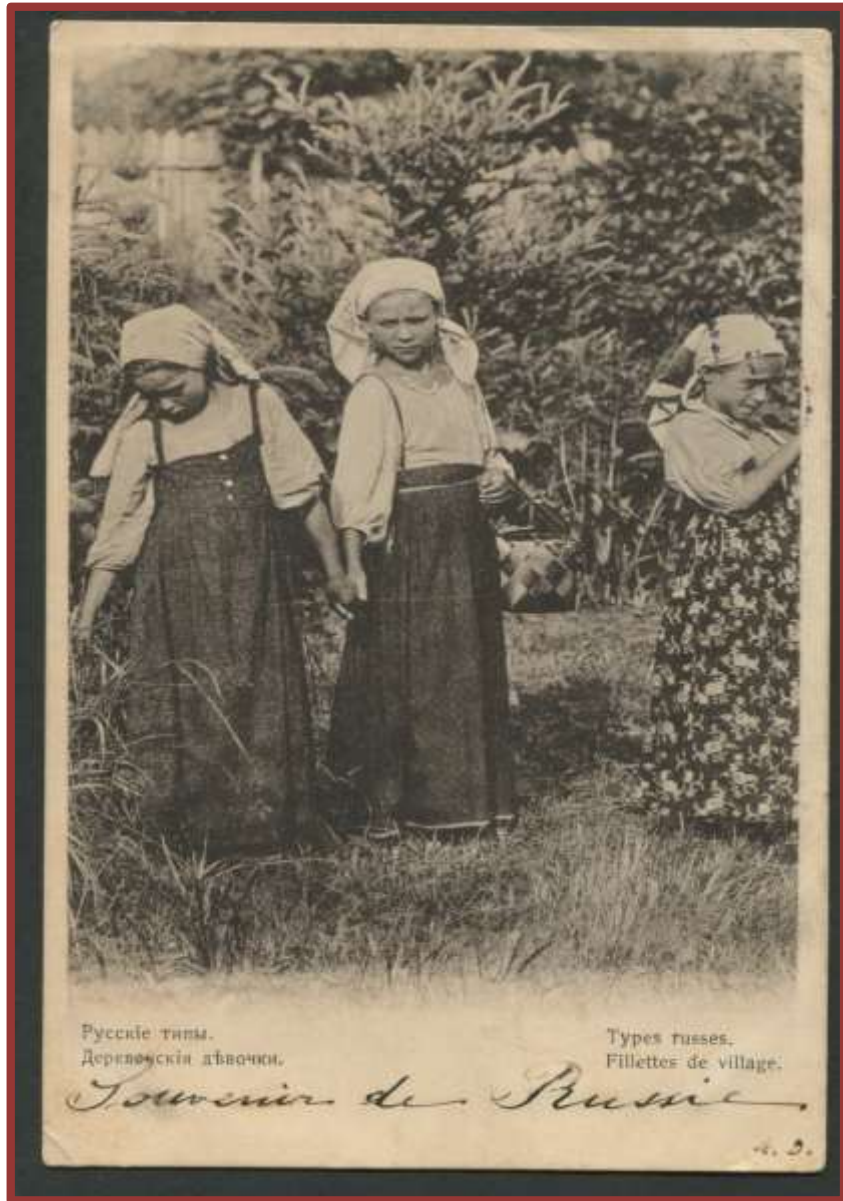
«Девочки. Русская деревня. Фото XIX в.»