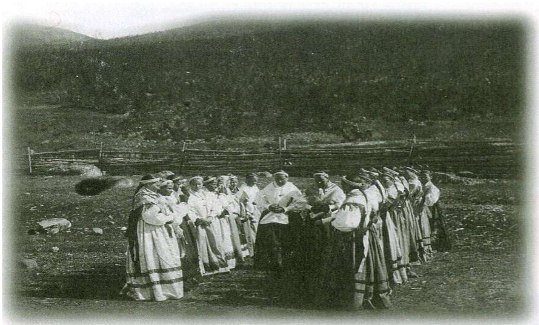
Девичий хоровод. Архангельская губерния, Кемский уезд, село Кандалакша