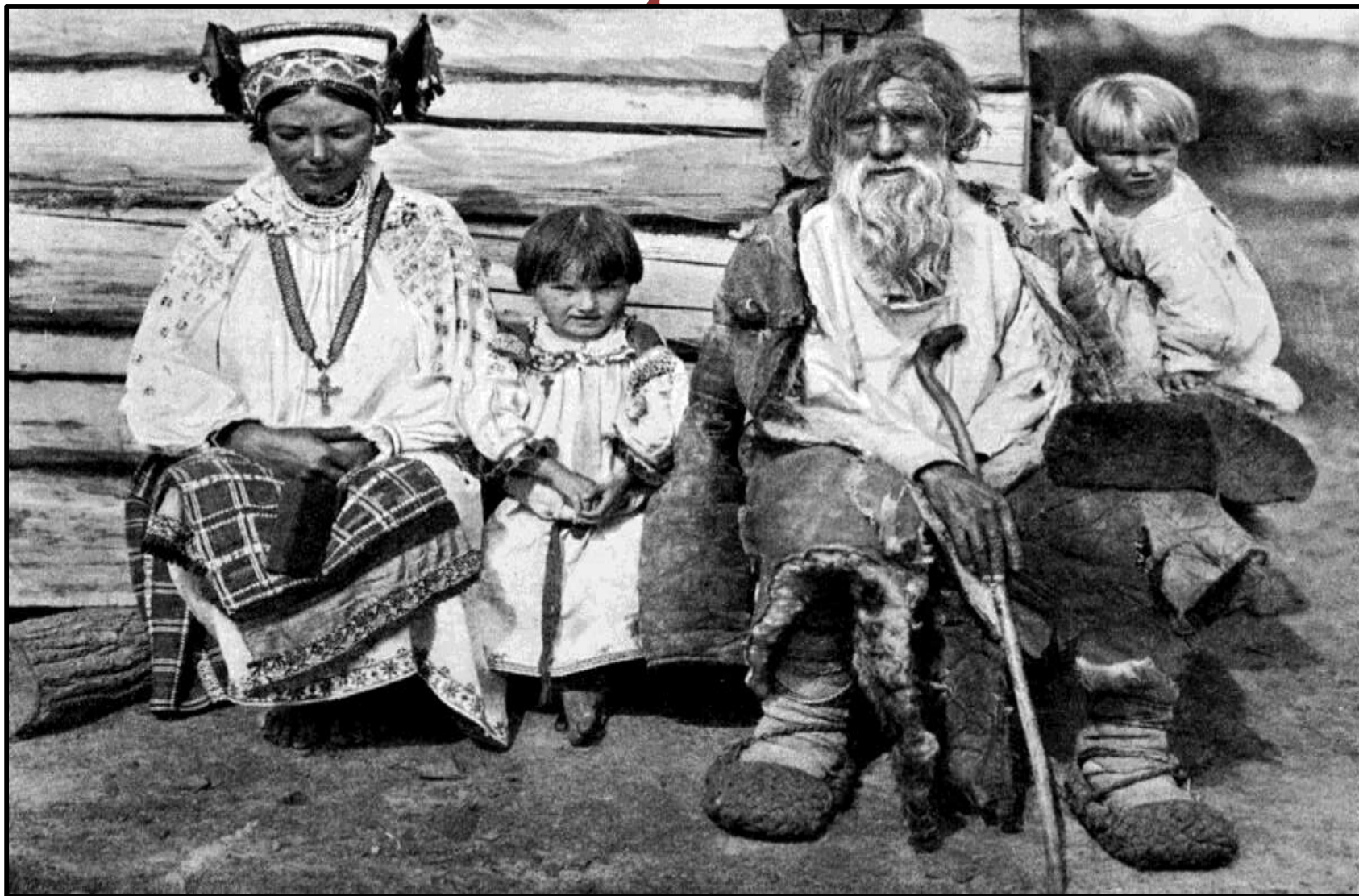
«Курская губерния. Фото XIX в.»