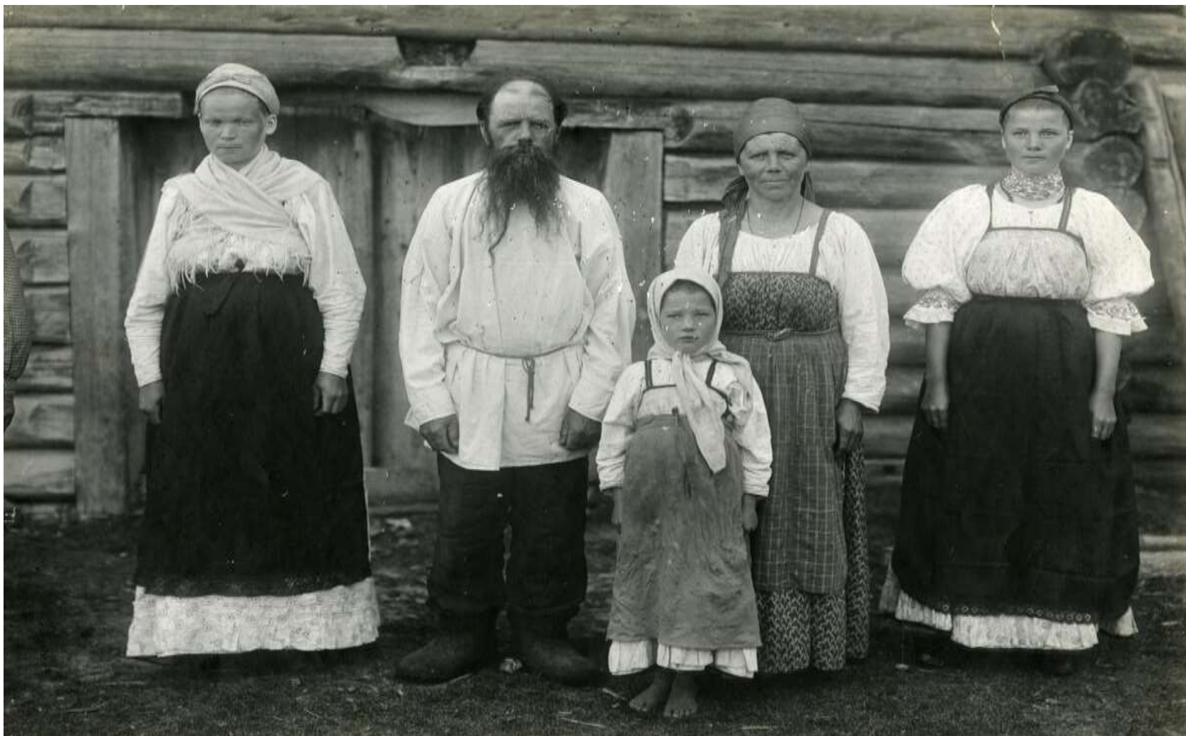
«Русский Север. Фото XIXв.»