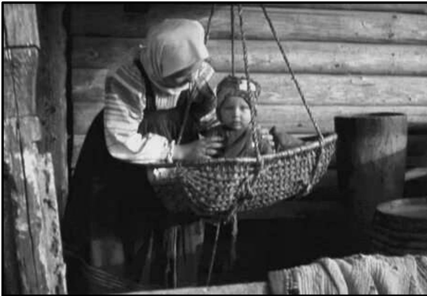
«Псковская область. Фото XX в.»