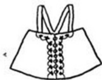
Душегрея. Вологодская губерния Перед