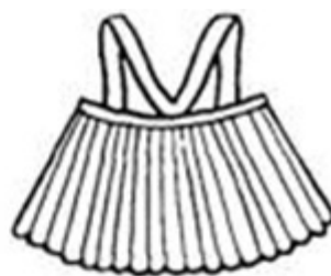
Душегрея. Вологодская губерния Спина