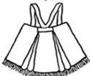
Епанечка. Нижегородская губерния Спина