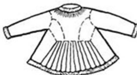
Шугай. Архангельская губерния Спина

Душегрея. Душегрея – самобытная русская одежда, которую носили женщины разных сословий. Это короткая, чуть ниже талии, и редко до середины бёдер, одежда. Шили душегреи из дорогих и нарядных тканей, в основном это были бархат, парча.