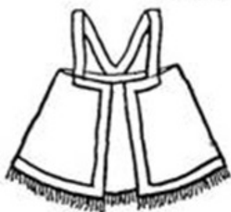
Епанечка. Нижегородская губерния Перед