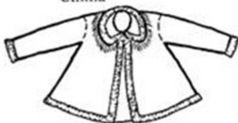
Шугай. Архангельская губерния Перед