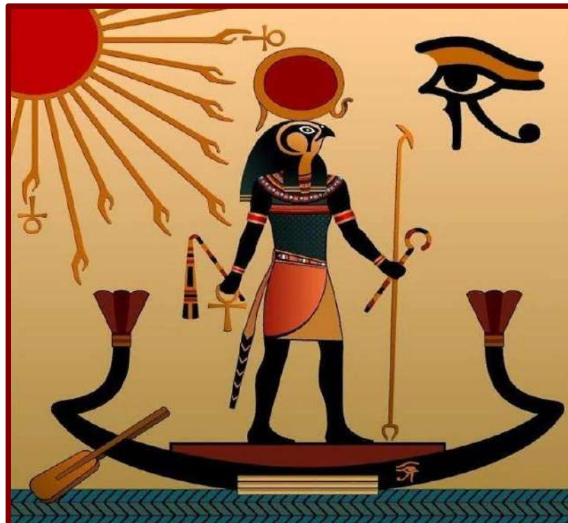
«Амон-Ра» – фреска из гробницы Тутанхамона

Завершив первичное обустройство мира богов и людей, Ра поселился на священном холме Бен-Бен в Гелиополе и проводил ночи в цветке лотоса, взлетая в небо на рассвете и паря в течение дня над землей.