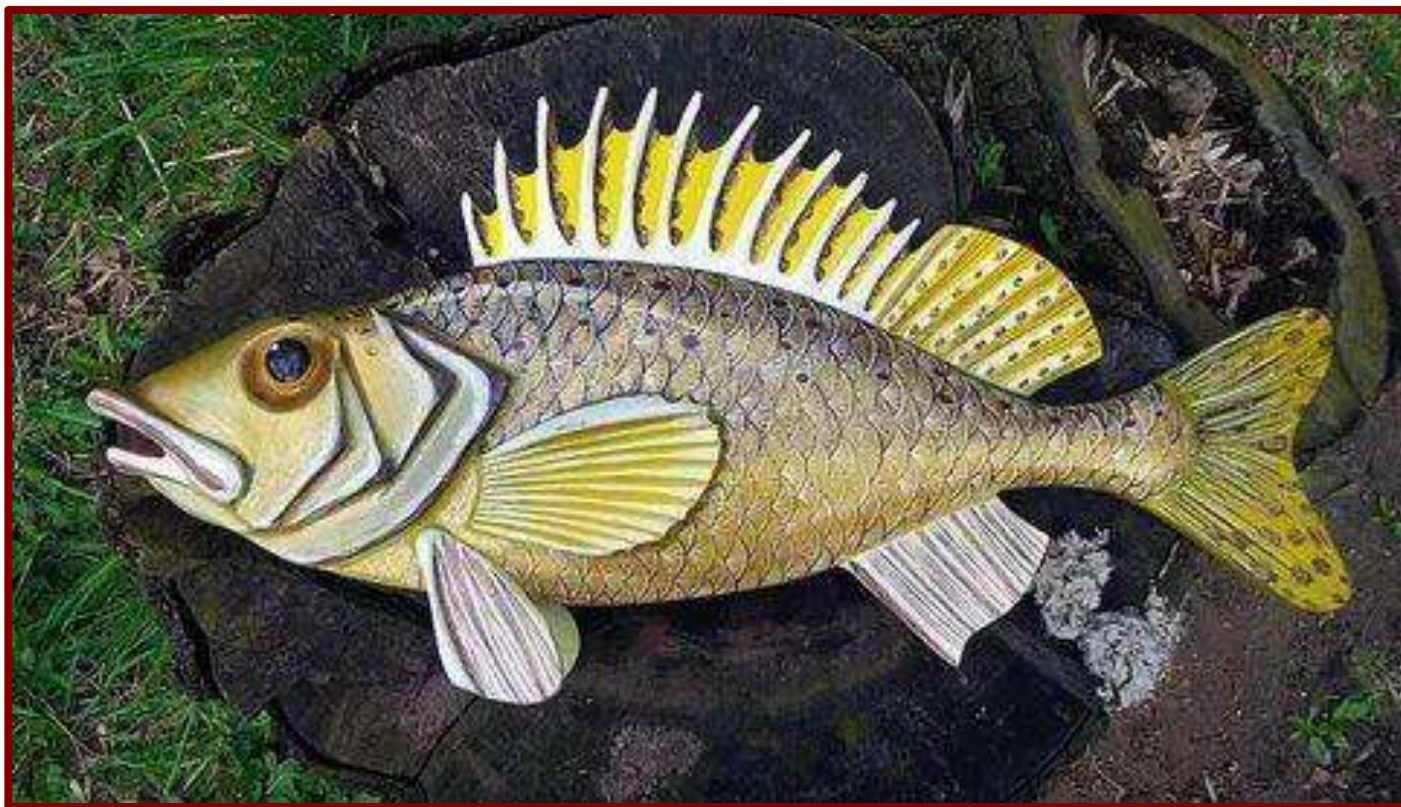
«Волшебная рыба». Иллюстрация А. Алехиной