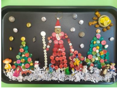
Фото композиций детей в технике свободный ассамбляж