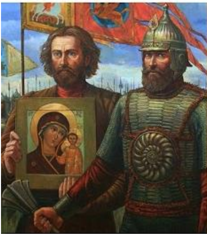
Кузьма Минин, Дмитрий Пожарский

города, как наш, произойдет такое великое дело". Назовите главных героев освобождения русского народа от Речи Посполитой?