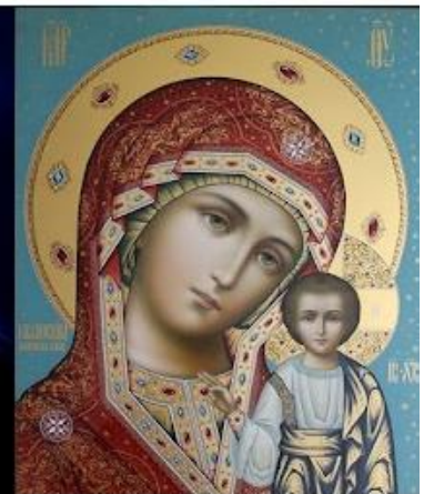
Казанская Пресвятая Богородица