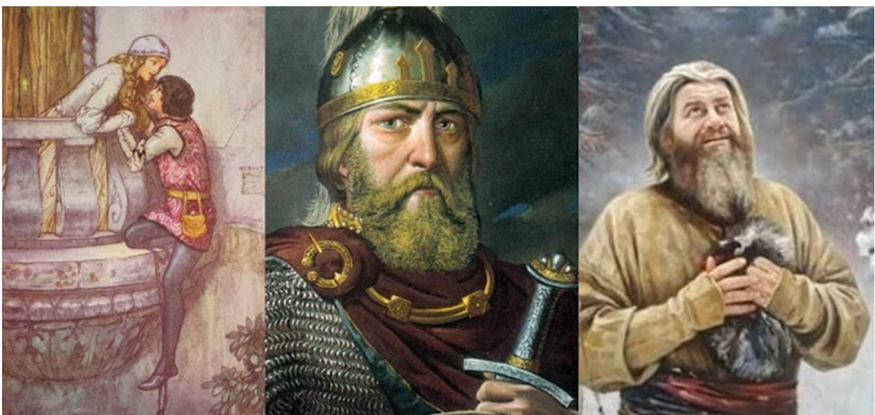
Ромео и Джульетта

Задание 7. Важное в жизни нашей страны событие не обошли своим вниманием люди творческих профессий: художники, писатели, композиторы. Так начинается одна из опер.