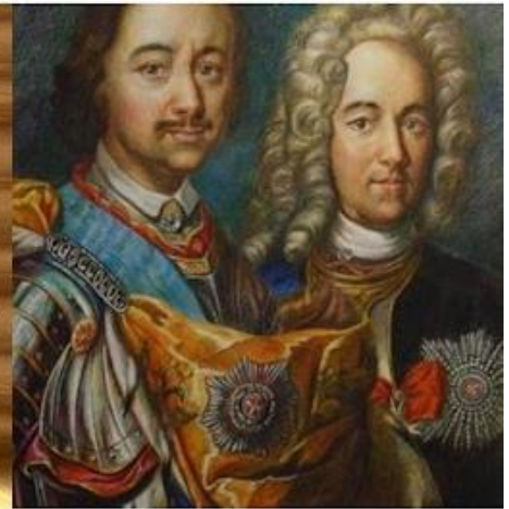
Петр I, Александр Меншиков