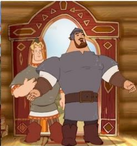
Илья Муромец, Алеша Попович