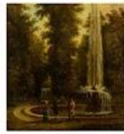
Фонтан в парке