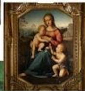
Мадонна с младенцем Иисусом и Иоанном Крестителем