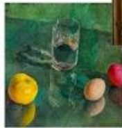
Натюрморт на зеленом фоне