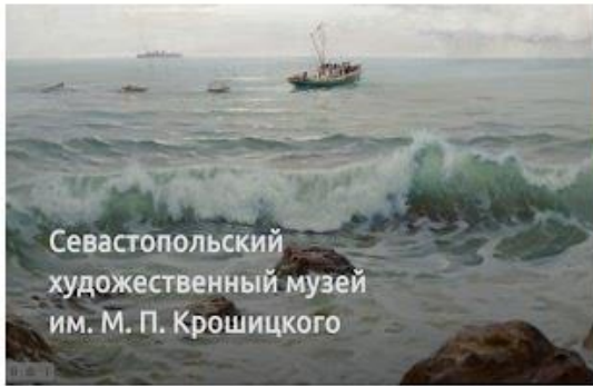
Севастопольский художественный музей им. М. П. Крошицкого