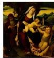
Мадонна с младенцем Иисусом, Иоанном и Св. Екатериной