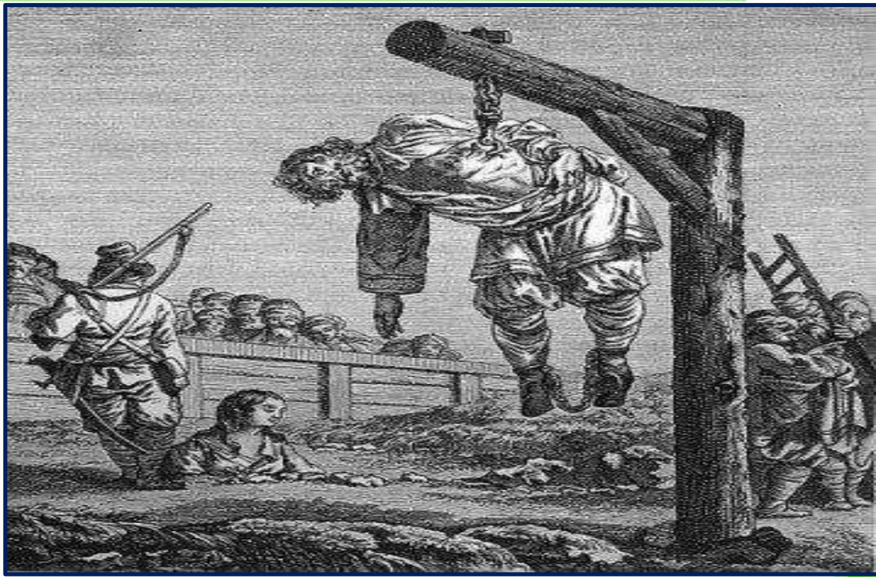
Суровое наказание- смертная казнь