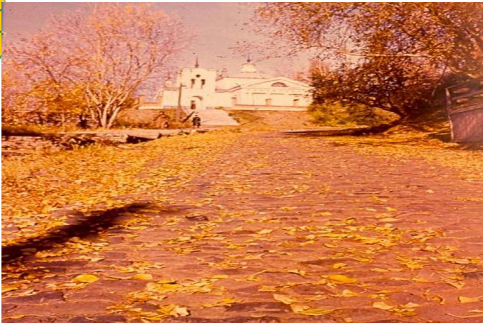
Центр города Томска