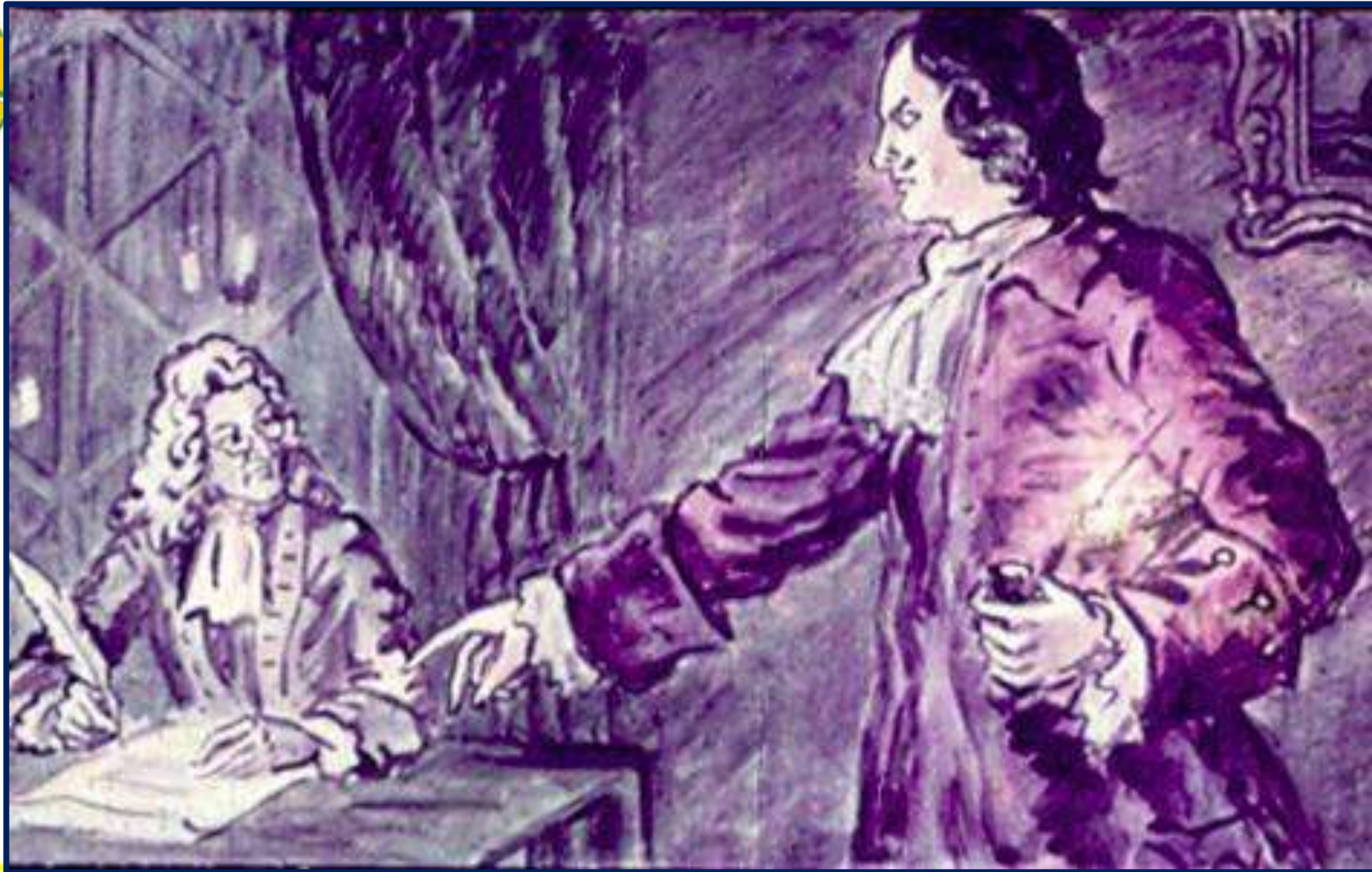
Написание указов о правилах на дороге, при Петра I