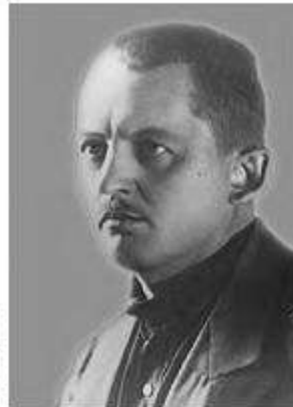
Георгий Иванович Сафаров (в разные годы жизни), участник репрессий на Романовых