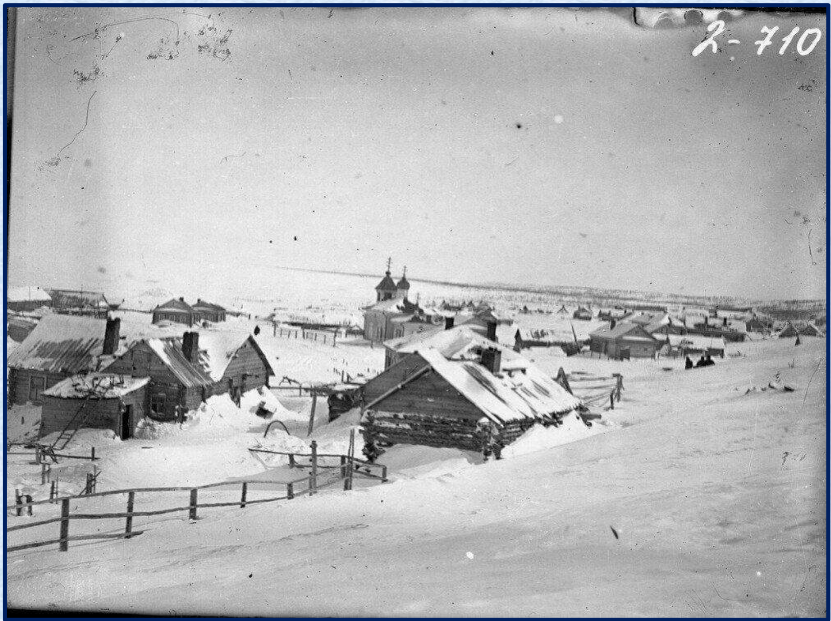
«Деревня. н. XX в. Фото»