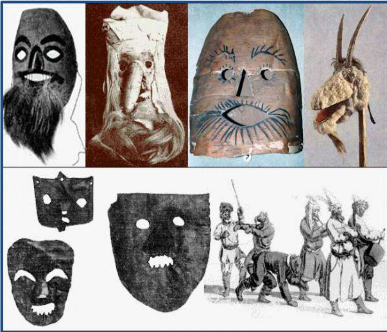
«Святочные маски» XIX в.