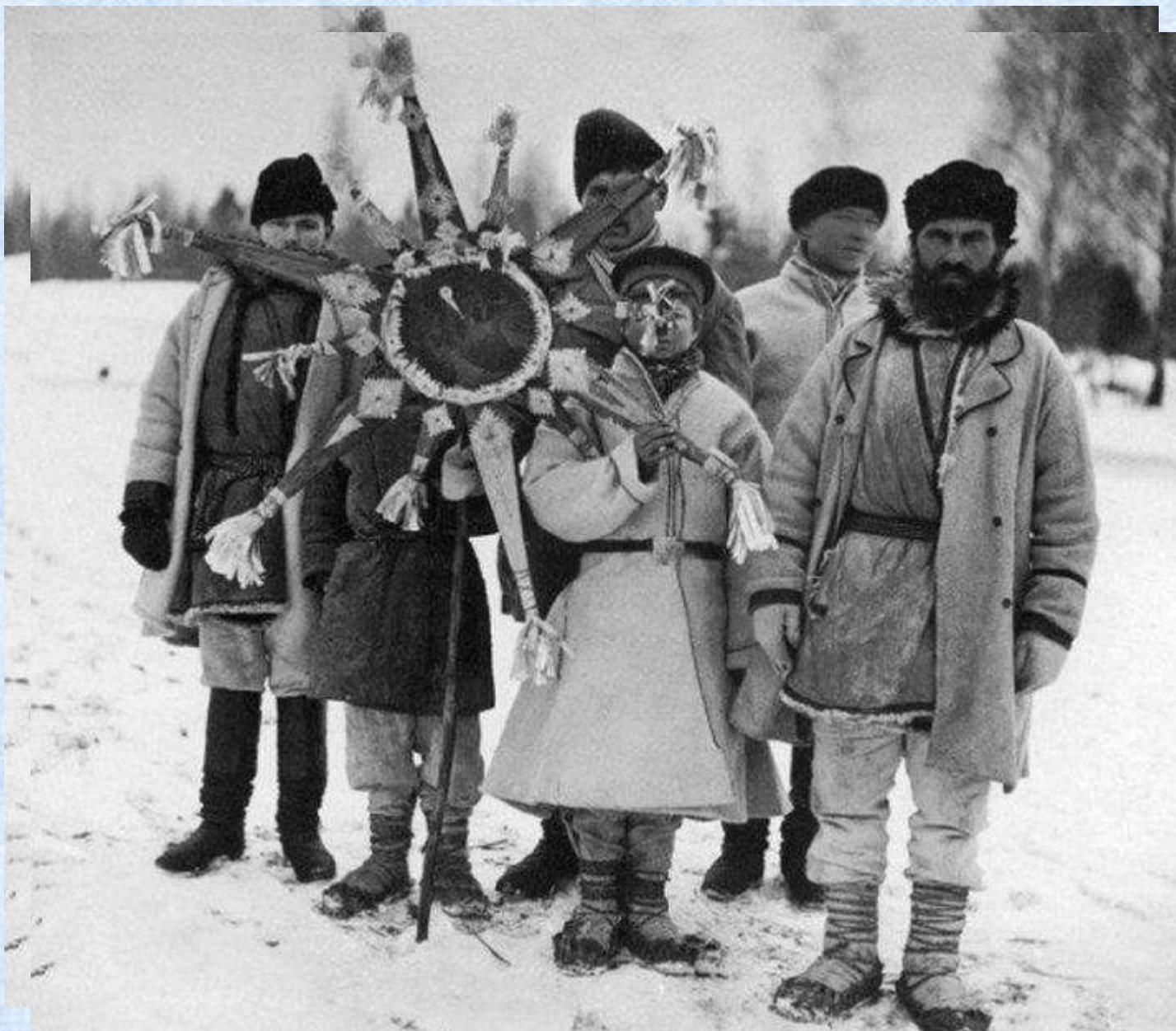
«Колядующие. Рязань к. XIX в. Фото»