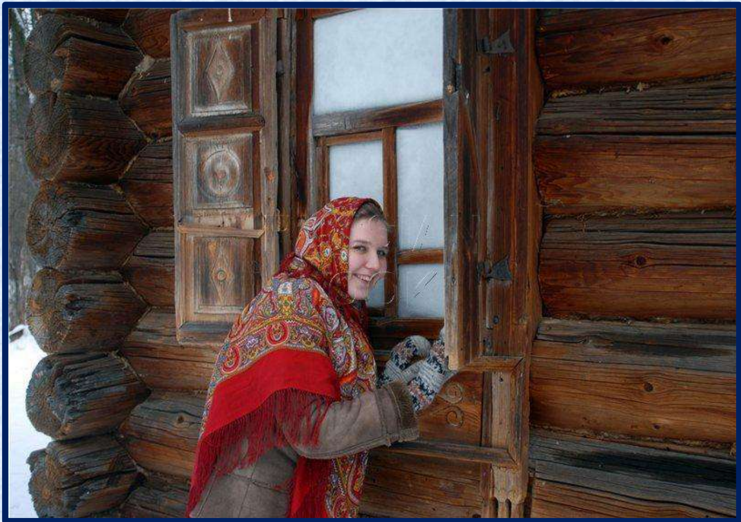
«Гадание у окна. Фото. XXI в.»