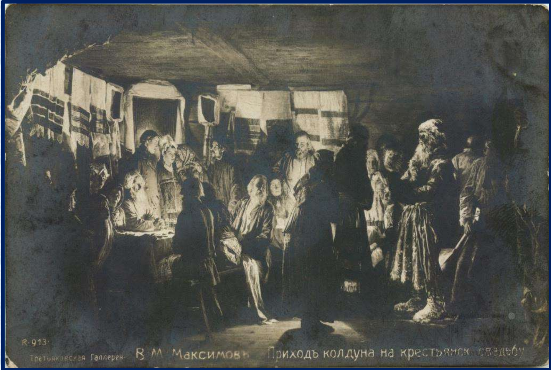
«Приход колдуна. Фото н. XX в.»