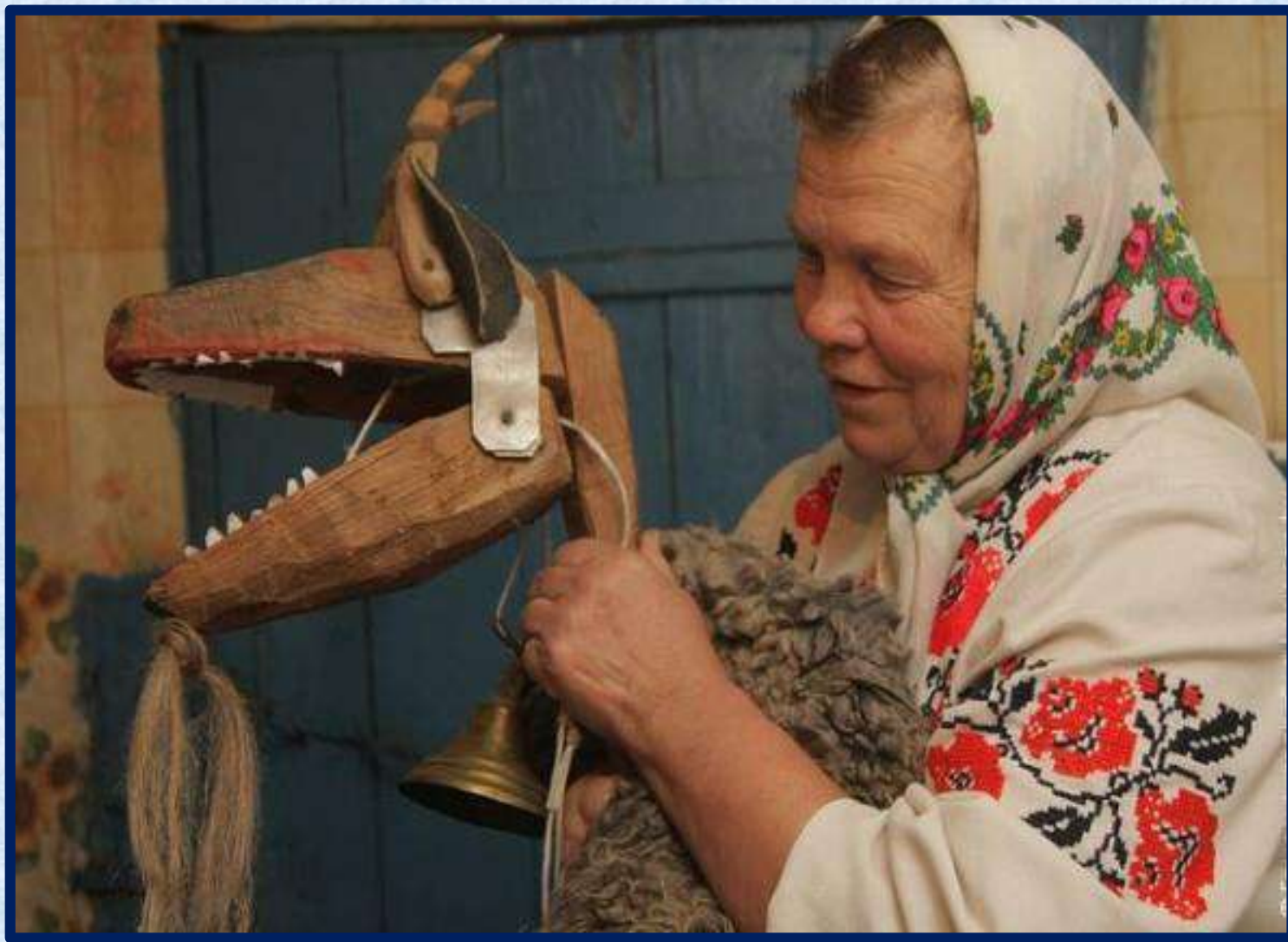
«Коза», н. XX в.