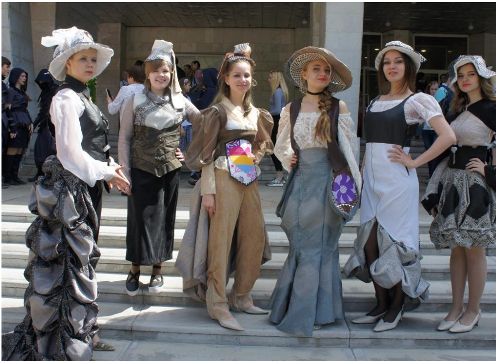
2020-2021 Коллекция «Pacific»