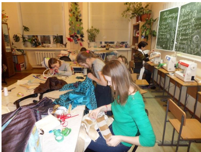
Зимой на улице под 30, а у нас вечерка!