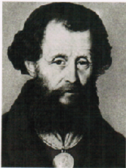
Е. А. Черепанов (1774—1842)