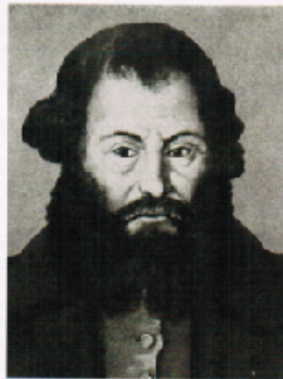
М. Е. Черепанов (1803—1849)