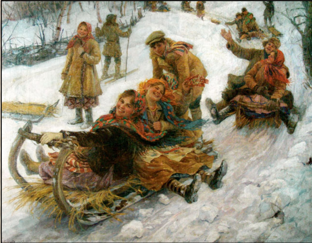
Ф.Сычков “Катание с гор”.

Катания на санках с горы, катание на лошадях