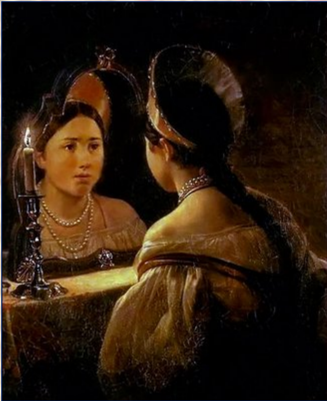
Брюллов Карл Павлович. Гадающая Светлана. 1836.

Гадания об урожае, подблюдные гадания устраивали девушки. На блюдо выкладывали различные предметы: кольцо, хлеб, солому, уголь, сахар. Все накрывали рушником. Пели магические формулы – заговоры. Затем девушки по очереди вытягивали из-под рушника предметы. У каждого предмета был свой магический смысл.