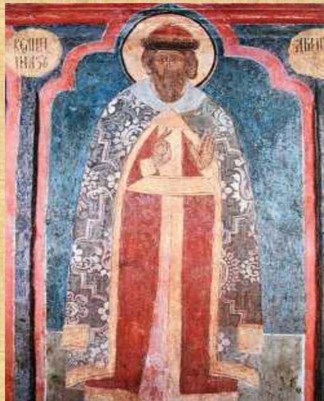
«Князь Всеволод Юрьевич», фреска Дмитриевского собора во Владимире