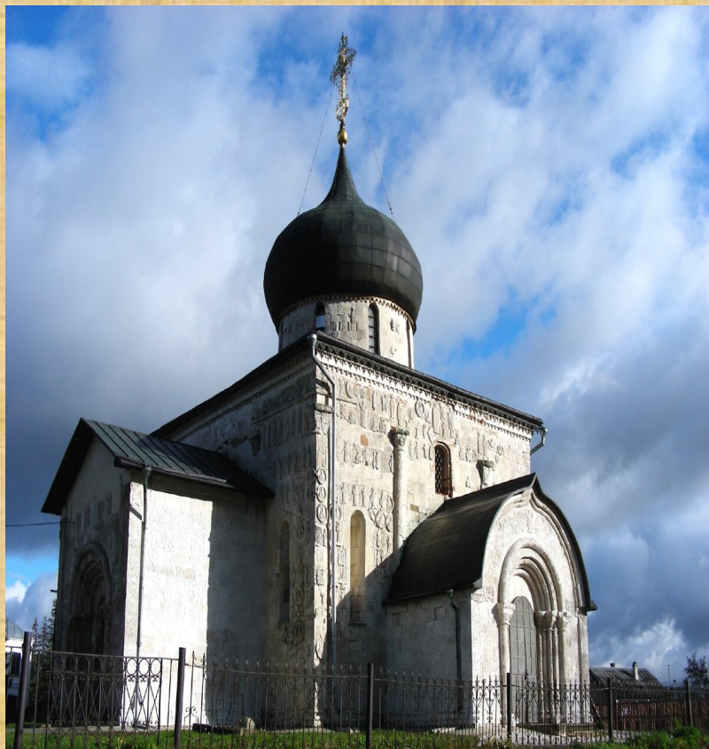
«Дмитриевский собор во Владимире