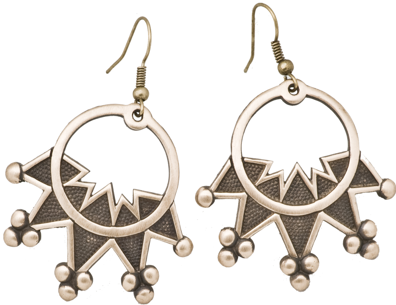
Височные кольца с литыми зубцами