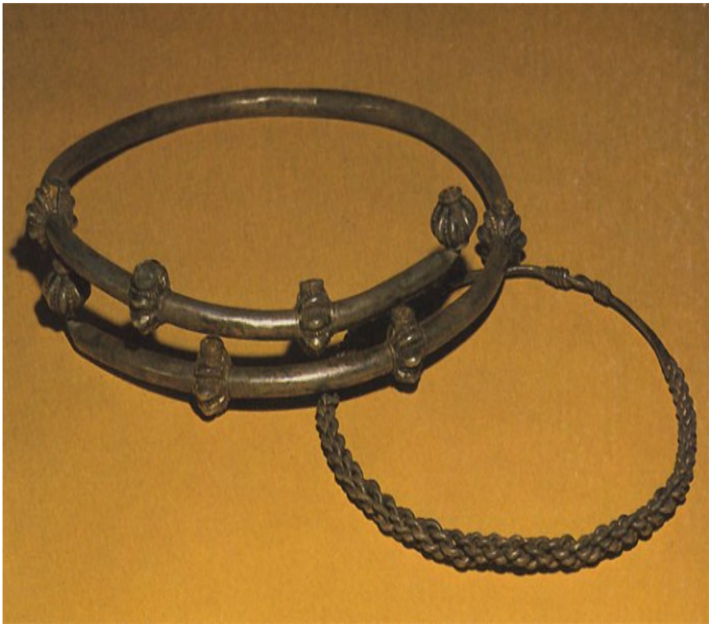
Дротовые шейные гривны