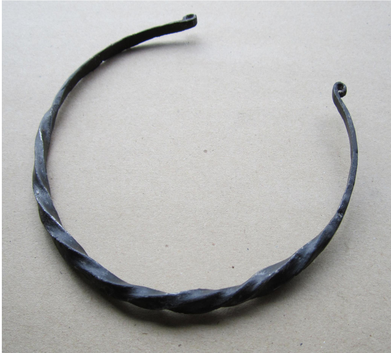
Витые шейные гривны