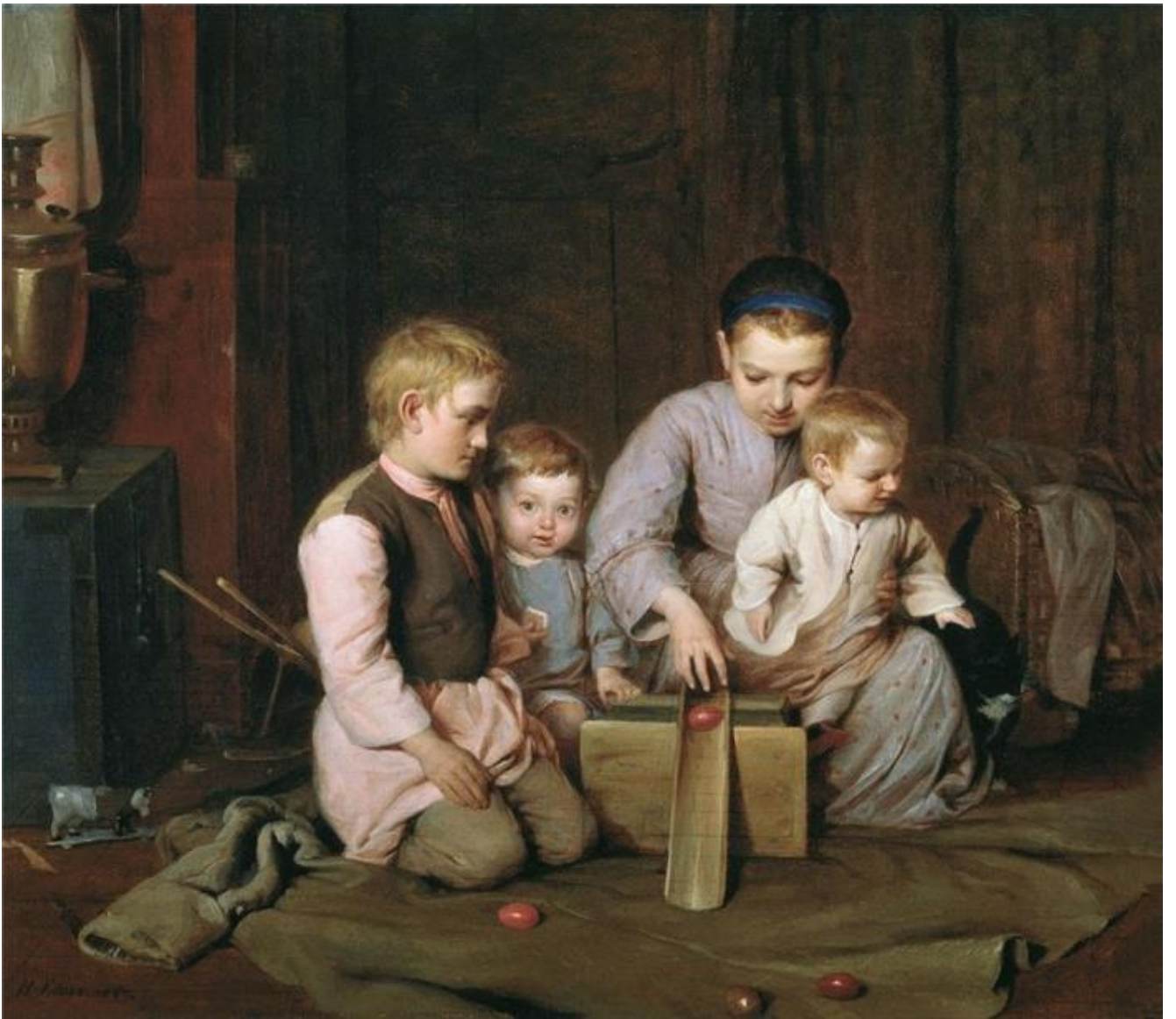
Кошелев Н. А. - Дети, катающие пасхальные яйца, 1855 г.