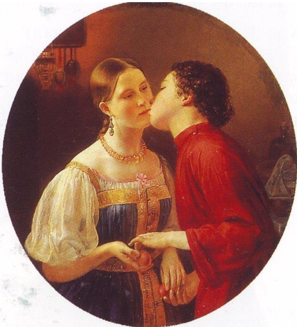
Фаддей Городецкий - Христосование, 1850 г.